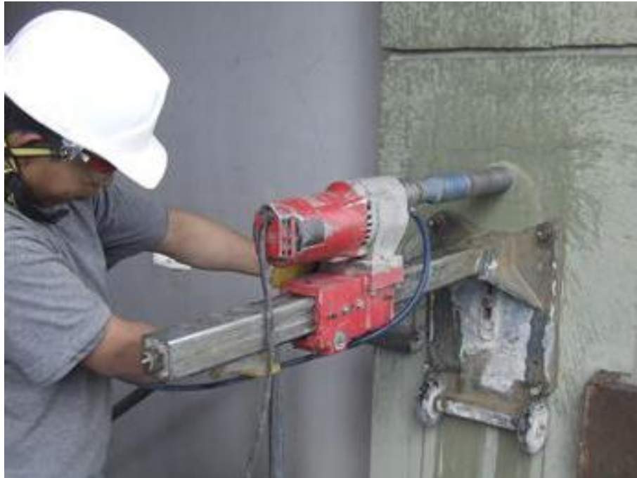
Figura 2. Extracción de corazones de una columna de concreto.