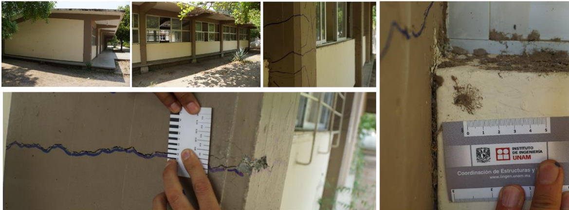
Figura 1. Medición de grietas.

Se clasificará el nivel o magnitud de daño de cada elemento de entrepiso de conformidad con las N-Rehabilitación.