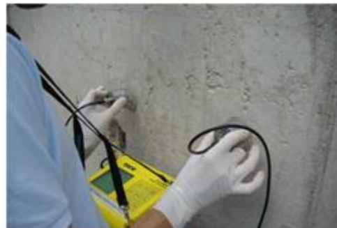
a) Equipo de ultrasonido