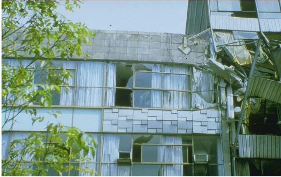
Figura 4. Golpeteo de edificios.